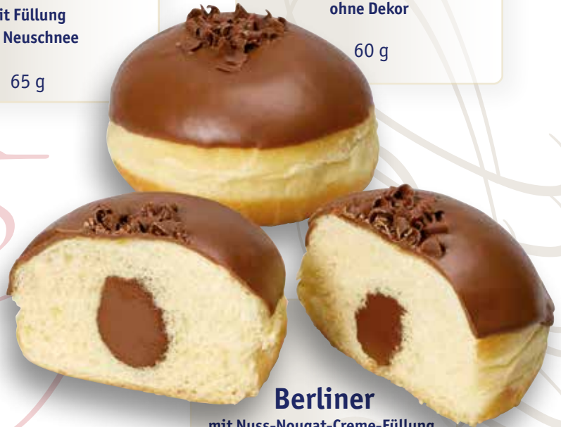
Berliner mit Nuss-Nougat-Creme-Füllung, Glasur und Schokolocken