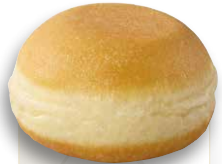
Berliner mit Füllung ohne Dekor