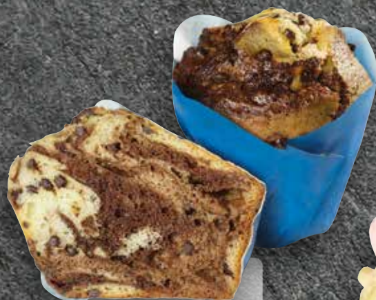
Vanilla Chocolate Twister Luxury Muffin