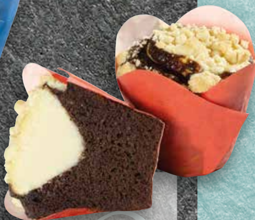
Cheesecake Chocolate Luxury Muffin