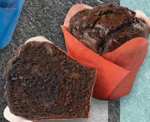
Double Choc Crunch filled Luxury Muffin