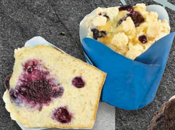
Blueberry Crumble filled Luxury Muffin