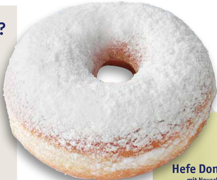
Hefe Donut XL mit Neuschnee

Einfach QR-Code scannen und Sie gelangen direkt zu weiteren Informationen über unser Produktportfolio auf www.bake-line.com