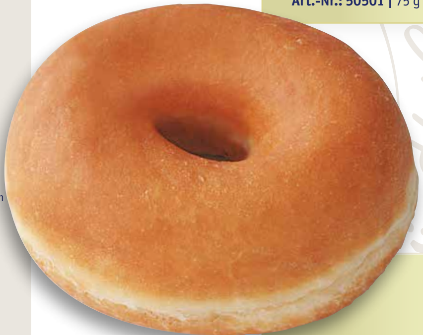
Hefe Donut XL Natur